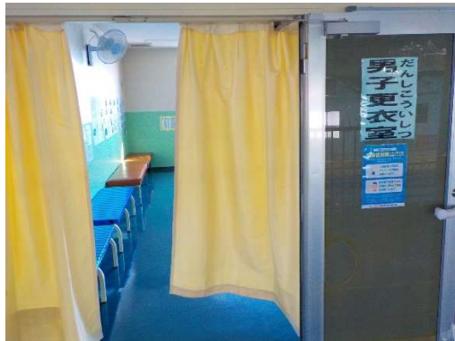
<男女更衣室の増設>

サウナ内では、常時換気を行い、ソーシャルディスタンスを保っていただく取り組みをしております。