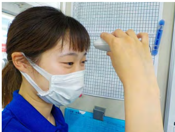
<毎日の検温・健康チェック>

またジュニア・幼児・ベビーコース指導員は飛沫感染予防対策の為プールマスクを着用し指導を行っております。