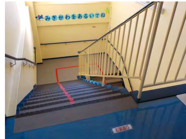
<館内導線の配置・誘導>