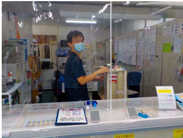
<フロントでのパーテーション>