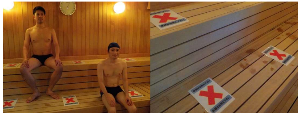
<サウナ内でのソーシャルディスタンス>