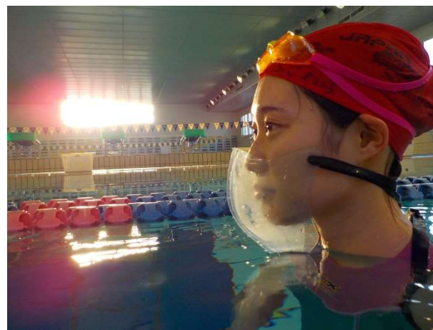
<プールマスクの着用>